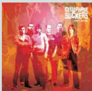
Can't Say No (2004)