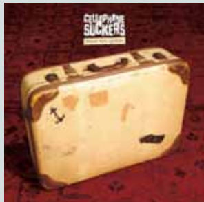
Bonjour Mon Capitaine (2008)