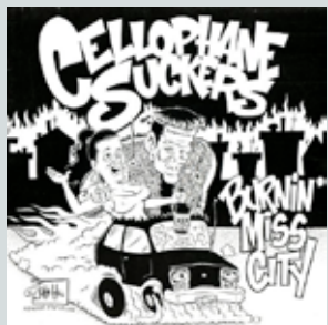
Burnin Miss City (1996)

Nenn es Rock'n'Roll, nenn es Punkrock, nenn es Rock! Was auch immer das Label ist, die Cellophane Suckers spielen mit Herz und Seele. Die „Saugnäpfe“ sind Fanboys! Von den Stooges und Stones zu den Saints, Dead Boys und den New Bomb Turks. Von Australien bis Skandinavien. Von der US of A. nach Japan. Von den Fidjis bis zu den Cayman Islands ... Die Liste der Einflüsse ist so lang, wie die jeder anderen Band. Sie begannen in den frühen neunziger Jahren, um aus ihren engen Dörfern rauszukommen. Das hat geklappt! Sie teilten die Bühnen in ganz Europa mit vielen musikalischen Helden und Freunden wie Bored!, New Bomb Turks, Dumbell, Hydromatics, Hellcopters, Cosmic Psychos, Onyas, Powder Monkeys, Zeke, Gluecifer, Sonny Vincent, den Sworn Liars, TBRNGR, The Golden Helmets, The Dirtys und unzählige andere. Der sechste Longplayer Suckers „One In A Zoo“ ist ein französisch / deutsche Zusammenarbeit mit ihrem eigenem HIGH NOON Label und dem großartigen BEAST RECORDS aus Rennes.