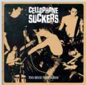
Too Much Temptation (2001)