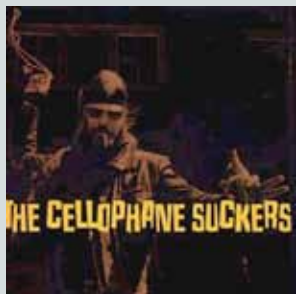
Hell Yeah (1998)